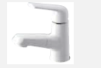
マルチシングルレバー 洗面〈シーライン〉