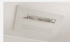
ゲンキ浴 i (アイ)・ ミスト