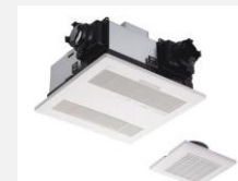
2室暖房 換気乾燥機