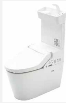
NewアラウーノV 手洗い付き

JIS A5207:2011に規定する「タンク式節水Ⅱ型大便器」または「洗浄弁式節水Ⅱ型大便器」もしくは、JIS A5207:2019に規定する「タンク式節水Ⅱ型大便器」または「専用洗浄弁式節水Ⅱ型大便器」と同等以上の性能を有すること