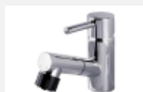
マルチシングルレバー シャワー〈ラシス・i-X洗面〉