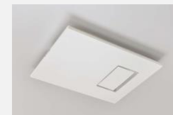
「ナノイー」搭載 カビシャット暖房換気乾燥機