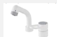
シングルレバーシャワー 〈シーライン〉