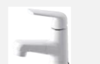
マルチシングルレバー シャワー〈シーライン〉