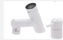
タッチレス水栓 〈シーライン〉