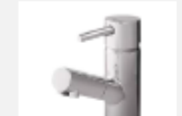
マルチシングルレバー 洗面〈ラシス・i-X洗面〉