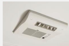
オートルーバー 暖房換気乾燥機