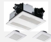
3室暖房 換気乾燥機