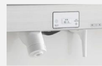
タッチレス/手動 水栓 〈ウツクシーズ〉