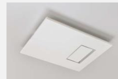
カビシャット 暖房換気乾燥機