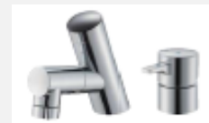
タッチレス水栓 〈ラシス〉