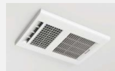
暖房換気乾燥機 (100V)マックス(樹)製