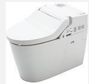
NewアラウーノV 手洗いなし